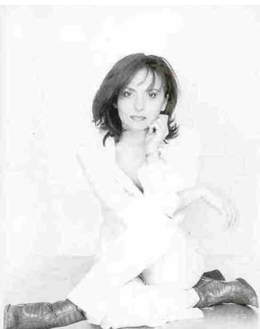
FestArte premia cinque giovani curatori